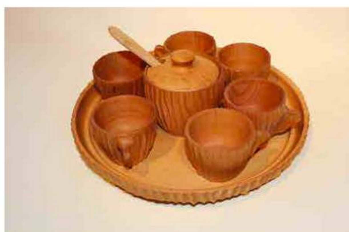
Servizio caffè in noce