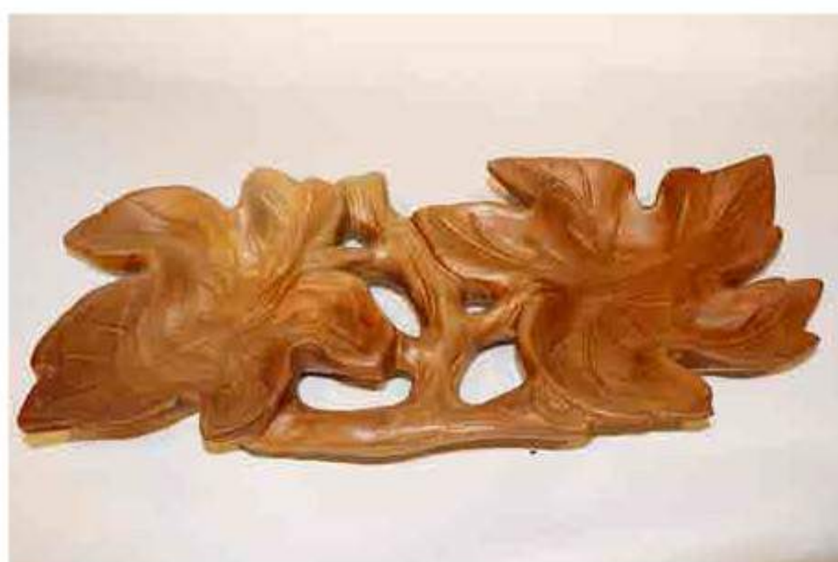
Vassoio "due foglie" in mogano