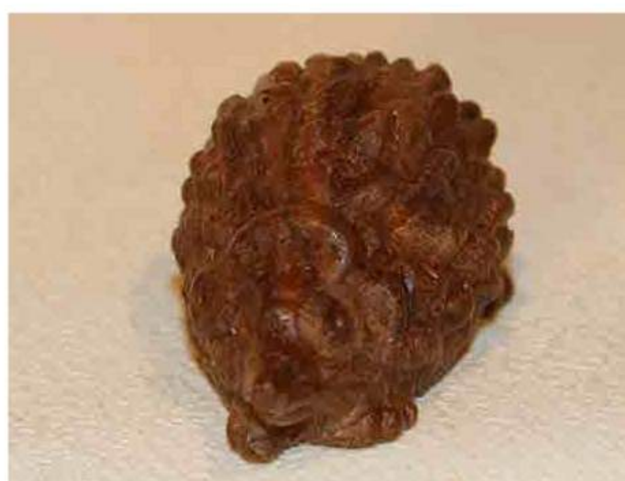
Riccio doppio grande