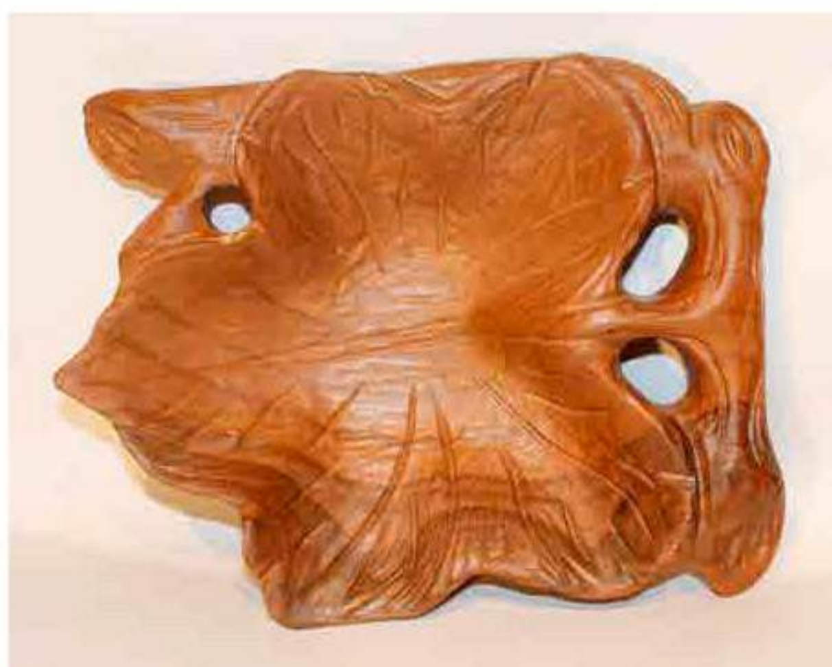
Vassoio foglia piccolo in mogano