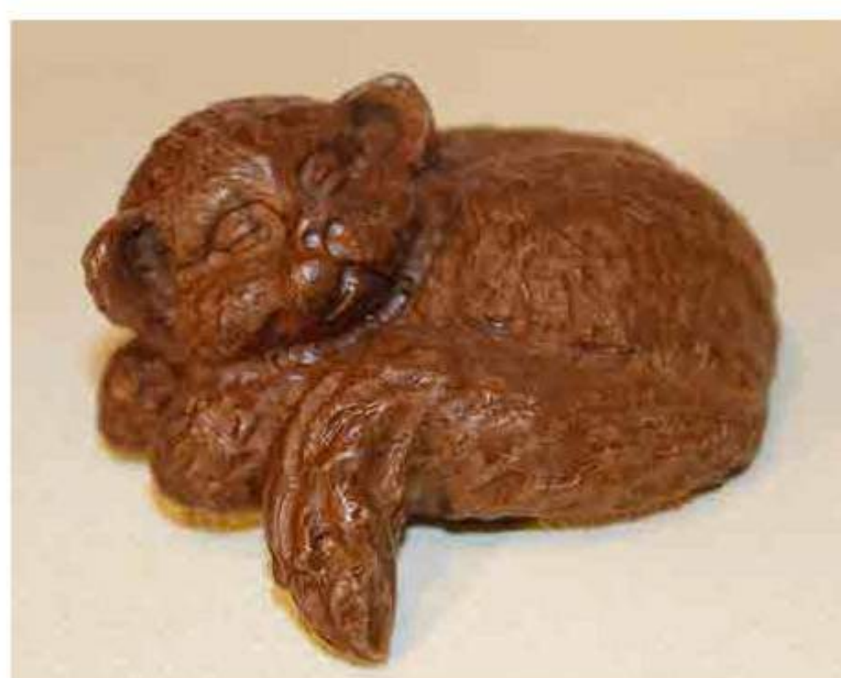
Gatto zampa verso l'alto