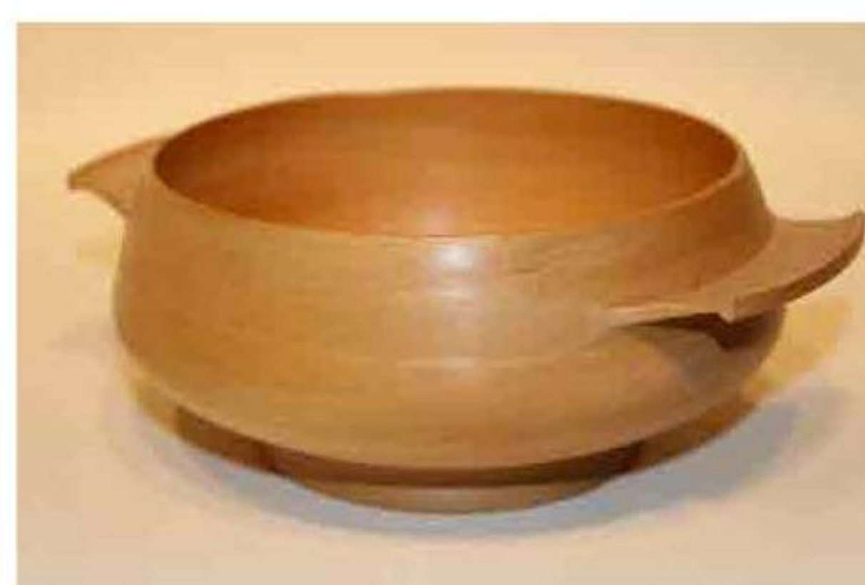
Ciottola vino grande in noce