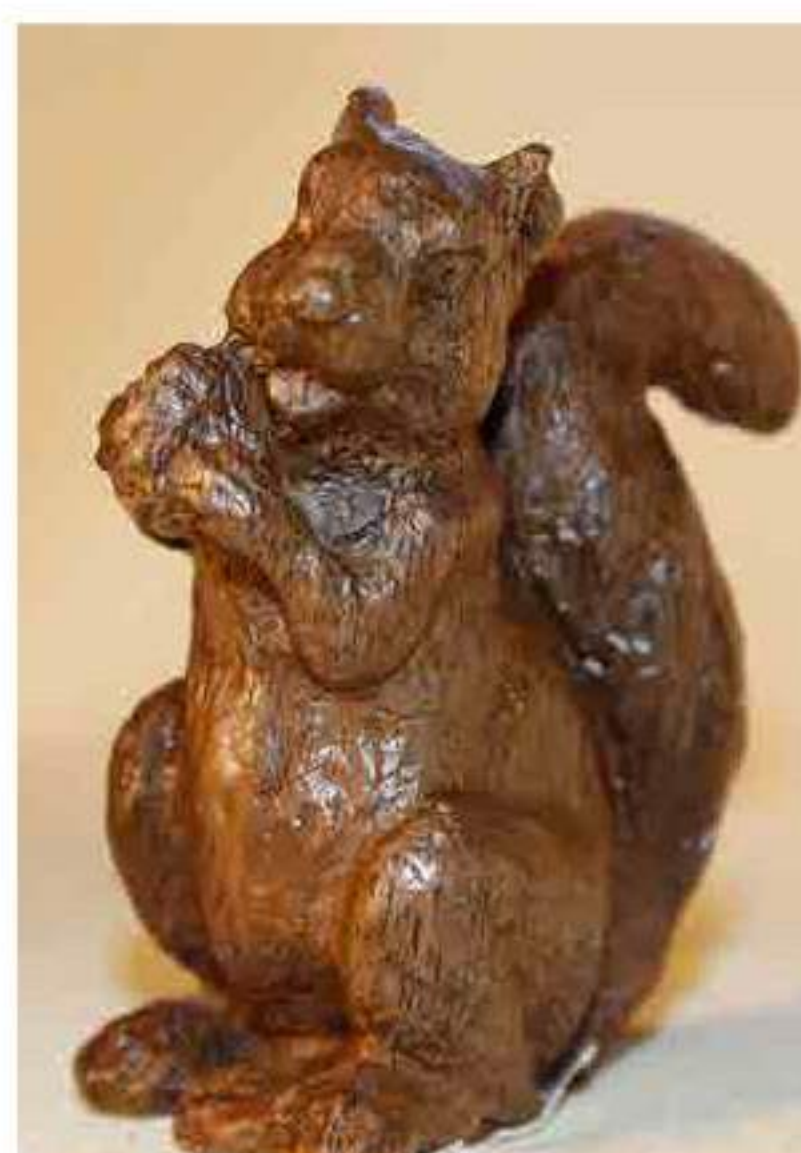
Scoiattolo coda alta € 21,00 I252A